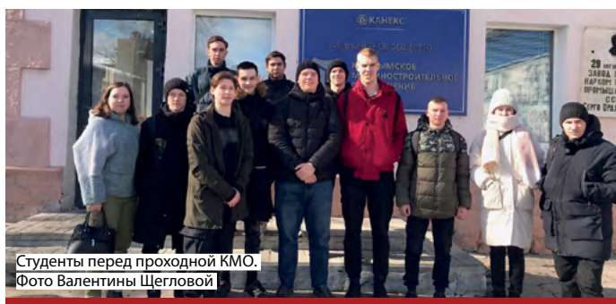
Студенты перед проходной КМО.

КМО сотрудничает с ЮУГК более полувека. Ежегодно его студенты проходят на заводе производственную практику, а по окончании обучения многие из них остаются работать. 🎓