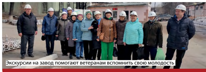
Экскурсии на завод помогают ветеранам вспомнить свою молодость

Мероприятие было организовано руководством КМО. Ветераны благодарят за предоставленную возможность посетить завод в преддверии его 265-летия. 🎓