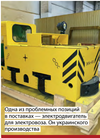
Одна из проблемных позиций в поставках — электродвигатель для электровоза. Он украинского производства

Просим сотрудников использовать для повседневных нужд черновики, ограничили закупку канцтоваров. Думаю, эта мера упреждающая, пока не стабилизируется рынок в целом.